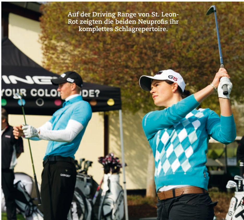
Auf der Driving Range von St. Leon-Rot zeigten die beiden Neuprofis ihr komplettes Schlagrepertoire.